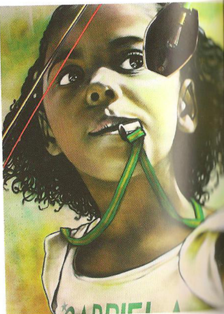
Fresque au plafond de Gabriela.

Ouvert du lundi au vendredi de 10h30 à 19h, le samedi de 10h à 13h30 et de 14h à 19h... et le dimanche de 10h à 14h.