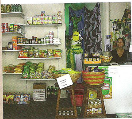
Coisas do Brazil, un comptoir indispensable.

Les pâtisseries sont aussi grasses et sucrées que leurs cousines portugaises, donc boudées des Français. Des desserts plus light les remplacent. Le guarana (soda stimulant obtenu à partir des graines d'une liane), la bière Brahma, les cocktails caipirinha (cachaça – alcool de canne à sucre –, jus de citron vert, sucre) et botido [cachaça et fruits] sont les boissons nationales.